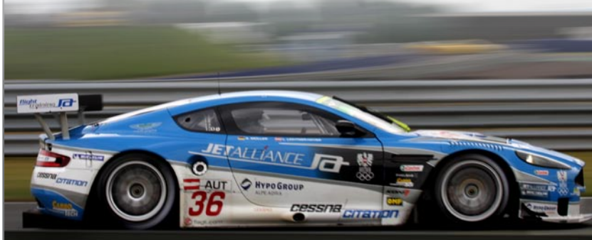
Jetalliance Racing nimmt mit einem Aston Martin DBR9 in der GT1 Klasse teil.

Das traditionsreichste Langstreckenrennen der Welt. Zum 77. Mal startet die Sportwagen und GT Elite bei dem 24 Stundenklassiker in Le Mans. Nach mehreren Siegen in der FIA GT Serie wurde das österreichische Team vom Veranstalter ACO (Automobile Club de l'Ouest) eingeladen und erhielt somit einen der begehrten 55 Startplätze.