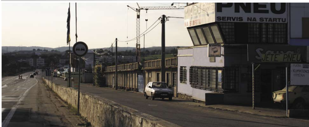
Kulisse für die Fotosession der neuen Kollektion: die ursprüngliche Boxenanlage in Brünn

Das nächste Rennen muss die "33" wegen der zuletzt guten Ergebnisse mit 70 kg Zusatzgewicht antreten, 40 kg für den Sieg in Adria und 30 kg für den 2. Platz in Brünn. Technikchef Welti nimmt es gelassen: "Die 70 kg sehe ich als eine Auszeichnung an."