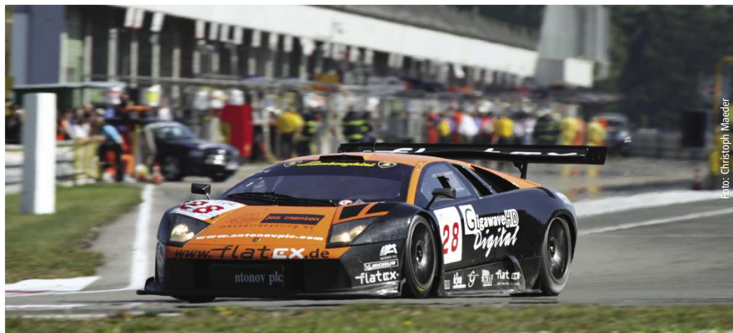
Der Reiter Lamborghini Murcielago lag bis 3 Runden vor Schluss auf Podiumskurs